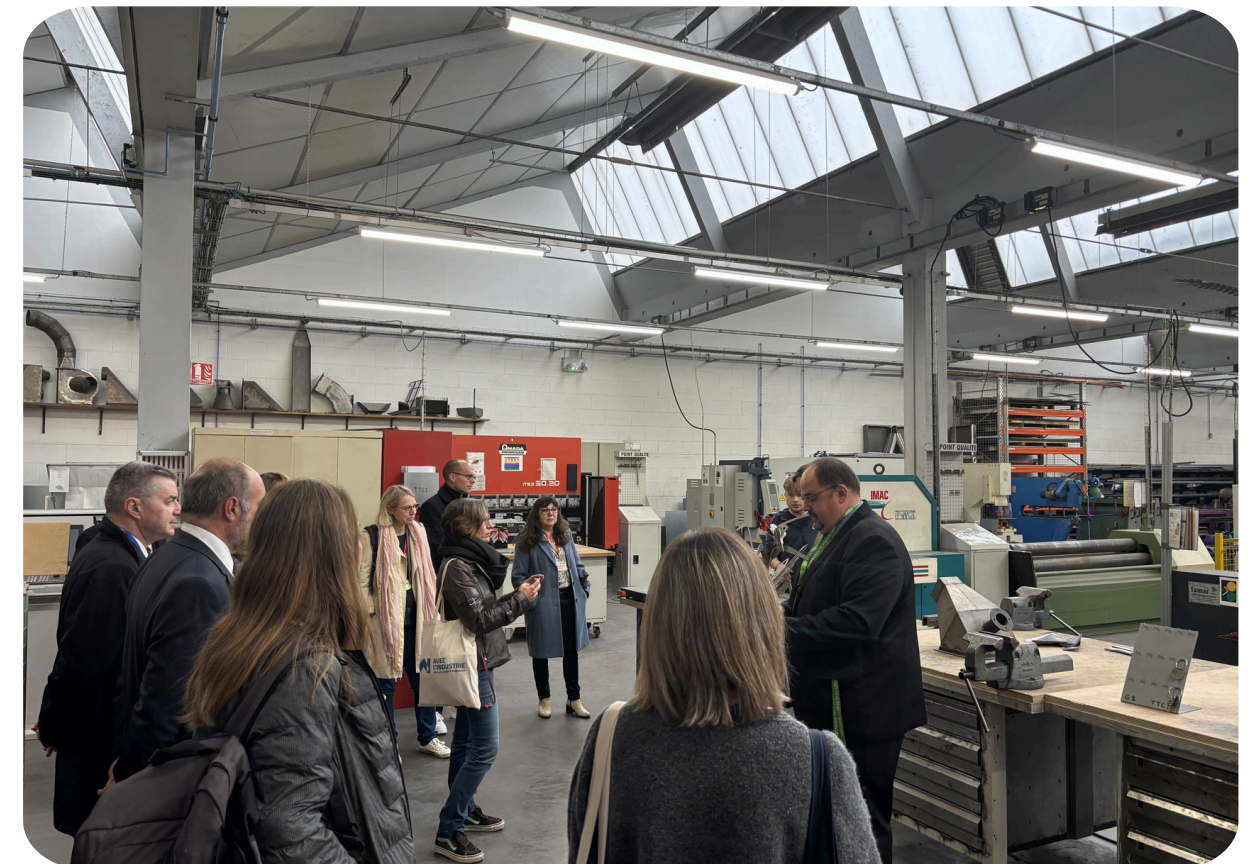
Visite des ateliers du lycée